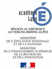
Rectorat de l'Académie de Lyon