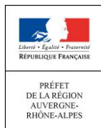
Préfecture de la région Auvergne-Rhône-Alpes Direction régionale aux droits des femmes