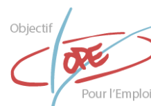
Objectif pour l'Emploi