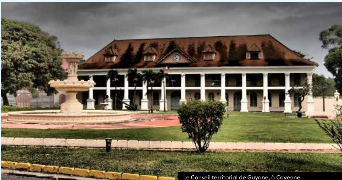
Le Conseil territorial de Guyane, à Cayenne