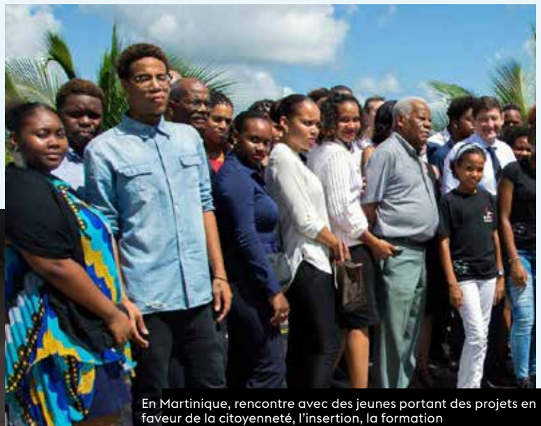
En Martinique, rencontre avec des jeunes portant des projets en faveur de la citoyenneté, l'insertion, la formation