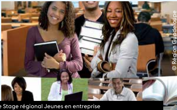
Le Stage régional Jeunes en entreprise

veloppement des compétences et de l'emploi dans le secteur du tourisme, en prenant en compte les besoins spécifiques du territoire ;