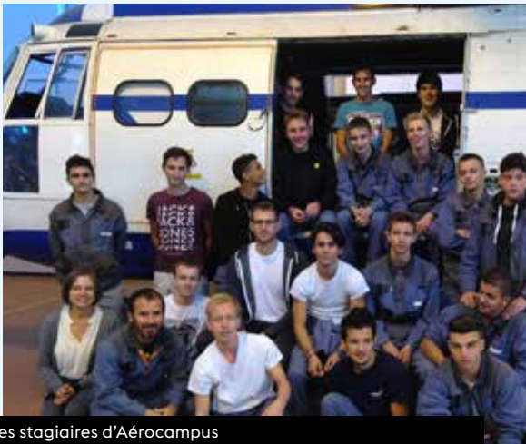
Des stagiaires d'Aérocampus

Un ancien site militaire acheté par le Conseil régional est désormais entièrement dédié à la formation aux métiers de la maintenance aéronautique, et géré par l'association Aérocampus Aquitaine.