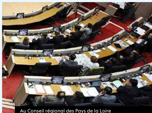
Au Conseil régional des Pays de la Loire