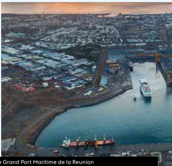
Le Grand Port Maritime de la Réunion

Un dispositif dont les premiers résultats semblent très prometteurs et ceux notamment grâce à une mobilisation inédite entre différents partenaires. Ainsi que des comités opérationnels mettent tous les acteurs régulièrement autour de la table pour veiller aux risques