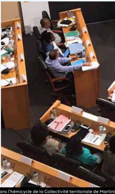
Dans l'hémicycle de la Collectivité territoriale de Martinique