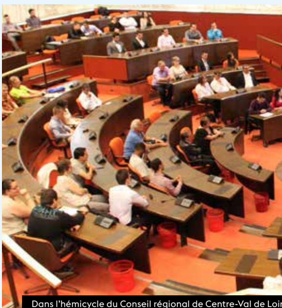
Dans l'hémicycle du Conseil régional de Centre-Val de Loire

Un bus a sillonné les six départements de la région, 15 villes-étapes, pour aller à la rencontre des demandeurs d'emploi sur les territoires, dans leur commune. À chaque étape, un accueil personnalisé était proposé par des conseillers Pôle emploi, Missions locales et par des interlocuteurs du Service public régional de l'orientation.