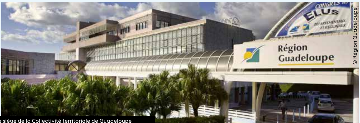
Le siège de la Collectivité territoriale de Guadeloupe