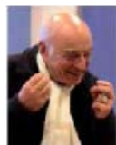
« Education et formation tout au long de la vie : les défis de ce 1 er Forum » Edgar MORIN (France), ethnosociologue et philosophe