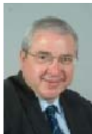
Président de séance Jean-Paul HUCHON (France) Président du Conseil Régional d'Île de France