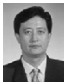
Shuanggu ZHANG (Chine) Ministre Conseiller, Délégation permanente de la République populaire de Chine auprès de l'Unesco